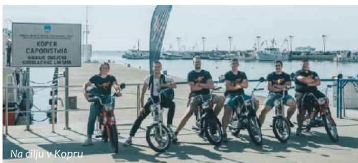
Na cilju v Kopru

A ne za dolgo, saj smo »šrafali« spet v Postojni. Naši fantje so res pohvale vredni, saj so po 5 poskusih uporabe »filtra«, za precejanje rje iz tanka, popravili tudi plovec, tako da so ga odstranili in uravnavali bencin skozi pipico. Pa smo bili spet nazaj na poti. Nič se ne