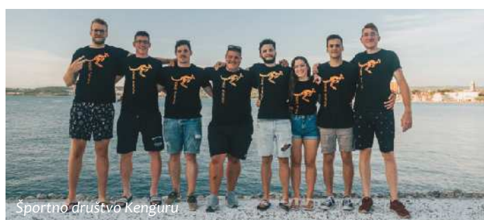
Športno društvo Kenguru