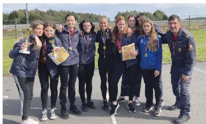
Regijske in ligaške prvakinje v kategoriji mladink.