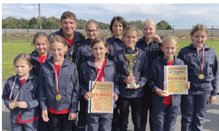
Ligaške prvakinje podravske regije v kategoriji pionirk.