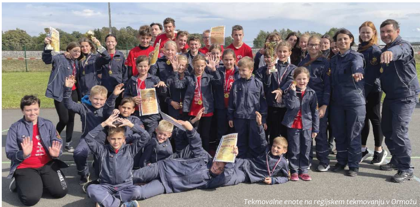
Tekmovalne enote na regijskem tekmovanju v Ormožu

rezultati gasilske lige. Mladinci so letos, zaradi nesodelovanja na treh tekmovanjih, v ligi ostali brez končne uvrstitve, pionirji pa so dosegli končno 5. mesto. Pionirke in mladinke so ponovno postale zmagovalke 6. pionirske in mladinske lige podravske regije. V celotnem obdobju lige (2020 in 2021 zaradi pandemije liga ni bila izvedena), so tekmovalne enote PGD Biš dosegle skupno 10 končnih zmag in 2 drugi mesti, kar je neverjeten rezultat.