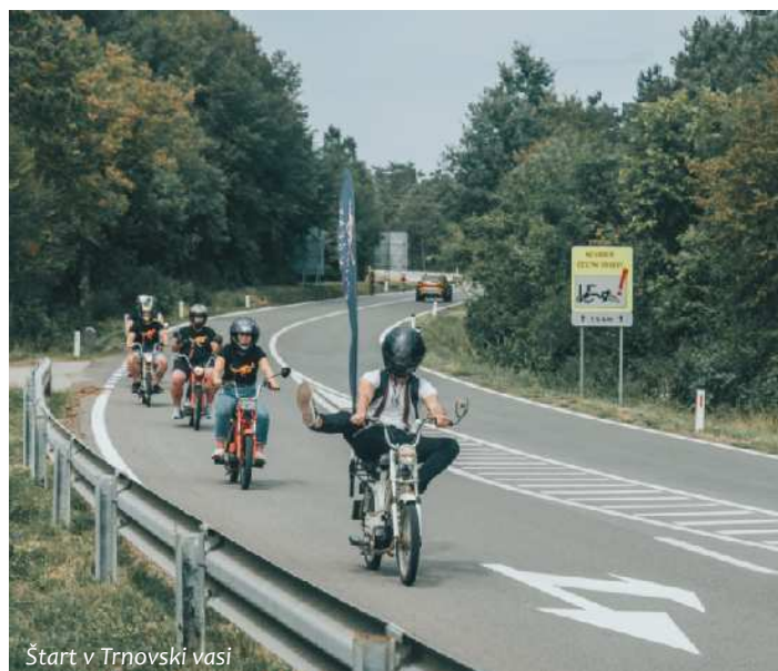
Start v Trnovski vasi

Športno društvo Kenguru je letos priredilo prav posebno popotovanje po Sloveniji, le za najpogumnejše, saj smo se odpravili na 310 km dolgo pot z mopedi Tomos. 3 čebelice in 3 APN-ke smo čez poletje pridno »šraufali« in »glancali«, da so bile 14. avgusta pripravljene na 2-dnevno turo, ki se je zaključila v Kopru, kjer je bila od leta 1954 tovarna motornih koles Tomos. Nedeljsko jutro smo začeli že zgodaj zjutraj in za Kengurujevo zastavo pičili proti Slovenski Bistrici, kjer smo imeli našo prvo postojanko. Vsaka postojanka je bila na približno 25-30 km, s tem pa smo poskrbeli, da se motorji niso pregreli. Že takoj nas je pričakalo prvo popravilo blatnika ter prednje zavore, a nič kar naši dečki ne bi mogli rešiti. Iz Slovenske Bistrice nas je pot peljala v Slovenske Konjice, kjer smo malo pred našim drugim »pit stopom« imeli prvi karambol, ko sem se